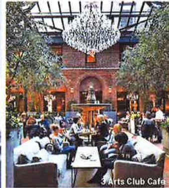
Arts Club Café