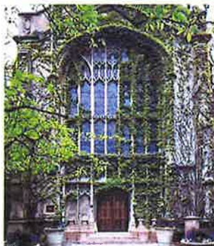
The University of Chicago